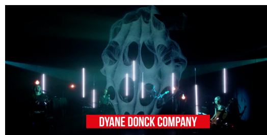
DYANE DONCK COMPANY